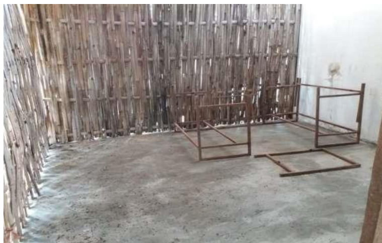
Gambar 3 Penampakan Gudang Setelah Berhasil Direnovasi