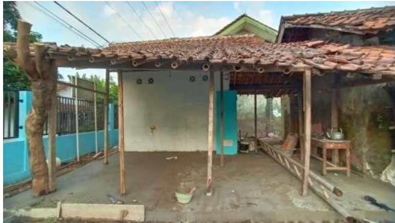
Gambar 2 Penampakan Gudang Dalam Proses Renovasi