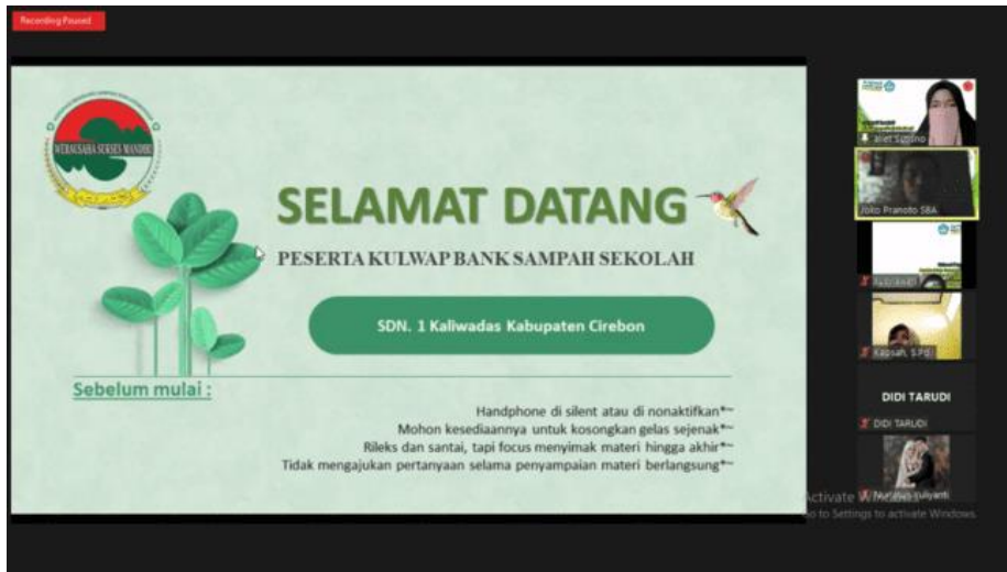
Gambar 4 Kegiatan Sosialisasi Dan Edukasi Pengolahan Sampah dan Mekanisme Bank Sampah Sekolah

Materi sosialisasi dan edukasi BSS seputar kajian lingkungan skala daerah kabupaten dan kota Cirebon, urgensi penanganan sampah daerah dari elemen satuan pendidikan, hingga pelatihan penanganan sampah langsung dari sumbernya melalui pengolahan sampah dengan memaksimalkan mekanisme pemilahan sebelum akhirnya sampah tersebut dibuang/dihimpun sesuai kategorinya.