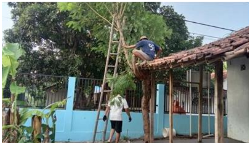
Gambar 1 Renovasi Gudang Sekolah

Bank sampah terealisasi dalam hitungan waktu kurang lebih satu bulan, dengan pembiayaan system kerjasama antara SDN I Kaliwadas dan Pendidikan tinggi UMC harapannya menjadi bukti kesungguhan Pendidikan Tinggi dengan Sekolah selaku mitra realisasi kurikulum Merdeka dengan tidak melepaskan aspek penting pola pembiasaan amsyarajat yang menadi harapan utama perubahan kesadaran masyarakat terhadap sampahnya. Program realisasi bank sampah mampu diwujudkan tentu dengan mengukur kesiapan dan kesigapan pihak mitra sekolah. SDN I Kaliwadas melalui program suksesti merdeka belajar kampus merdeka menunjukkan kesiapan menyongsong pembangunan berkelanjutan yang berkemajuan dengan menjadikan lingkungan sebagai alternative pendekatan masyarakat mengedukasi kesadaran mereka terhadap sampahnya melalui kegiatan pemilahan sampah secara massive melalui alat bantu Bank Sampah Sekolah yang hadir menstimulus rasa keiinginan masyarakat dalam menekan sebaran sampah dilingkungannya. Hal ini ditempuh sebagai salah satu bentuk rekayasa perilaku masyarakat menuju pembangunan SDM tanpa mengenyampingkan SDA. Integrasi antara sekolah dengan pihak WSM yang dalam hal ini membawahi Bank Sampah Sekolah (BSS) di SDN I Kaliwadas dinilai efektif dalam mengikat keberlangsungan upaya edukasi perilaku masyarakat sekaligus Langkah riil menekan sebaran sampah di masyarkat serta menumbuhkan ketahanan pendidikan masyarakat yang sesungguhnya.