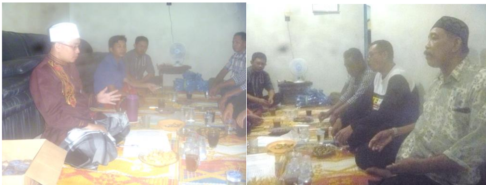
Gambar 5. Kegiatan Sosialisasi pentingnya pelestarian kesenian kompangan dalam kehidupan masyarakat terutama dalam membentuk karakter generasi muda

Untuk membangun dukungan dari masyarakat, dilakukan sosialisasi urgensi kesenian kompangan bagi pembentukan kebudayaan local terutama pada daerah pemukiman baru seperti daerah perumahan. Sosialisasi dilakukan dalam bentuk ceramah, diskusi dan tanya jawab. Materi ceramah mengangkat topic-topik karakteristik kesenian kompangan, manfaat dan fungsinya dalam kehidupan masyarakat daerah Jambi yang digali dari berbagai sumber. Sosialisasi dihadiri oleh sebagian besar (95%) masyarakat Perumahan Arza Griya Mandiri Desa Mendalo Indah. Hasil tanya jawab dan diskusi mengindikasikan sikap positif dan dukungan baik secara moril maupun materiel masyarakat terhadap pengembangan kesenian kompangan di daerah tersebut.