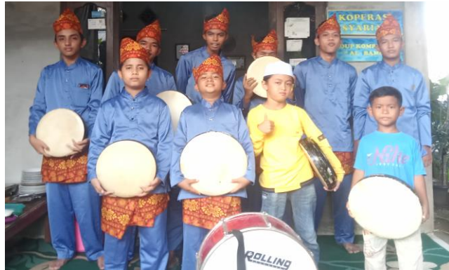
Gambar 2. Pemain Kesenian Kompangan Perum. Arza Griya Mandiri Desa Mendalo Indah