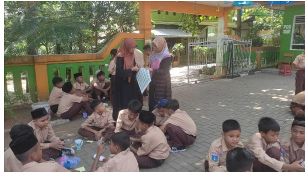
Gambar 6. Pengemasan Sabun

Pada sesi ketiga, peserta diajak untuk mengemas adonan sabun yang telah terbentuk. Pada sesi ini, peserta tampak begitu antusias. Mereka dibentuk dalam kelompok-kelompok untuk mengemas adonan sabun dalam dua kemasan yang berbeda.