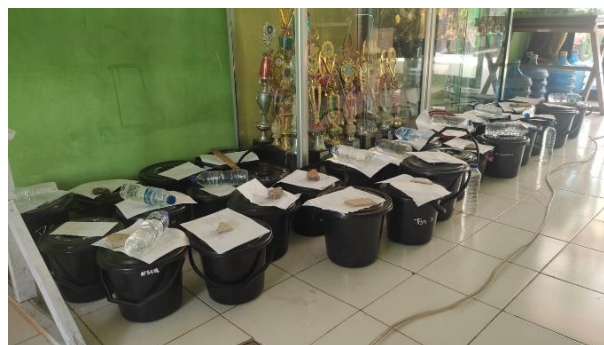
Gambar 5. Adonan Sabun

Setelah penyampaian materi dari Ibu Resmaleni usai, kegiatan dilanjutkan dengan praktik pembuatan sabun dari limbah air AC. Pada tahap ini, anak-anak dicontohkan tentang penyusunan komposisi untuk membuat sabun. Sabun yang dibuat pada sesi ini ada dua jenis yakni sabun cuci tangan dan sabun cuci piring. Pada sesi ini, pembuatan sabun hanya sampai pada tahap membuat adonan sabun yang ditempatkan pada sebuah ember. Kemudian adonan sabun tersebut dibiarkan beberapa hari dan dilanjutkan pada sesi berikutnya.