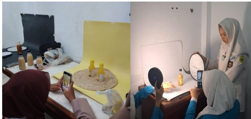
Gambar 5. Praktik pemotretan produk

digital, pada kegiatan ini siswa membawa perlengkapan yang dibutuhkan untuk kepentingan pemotretan produk seperti baground, cermin dan kertas karton, selain itu juga siswa menggunakan smartphone untuk keperluan pemotretan produk serta pencahayaan. Dalam sesi pelatihan ini siswa bekerjasama dengan kelompok yang telah dibuat sebelumnya dengan tujuan supaya tidak merubah hasil akhir serta merubah komposisi dan rencana yang dibuat oleh kelompk masing-masing.