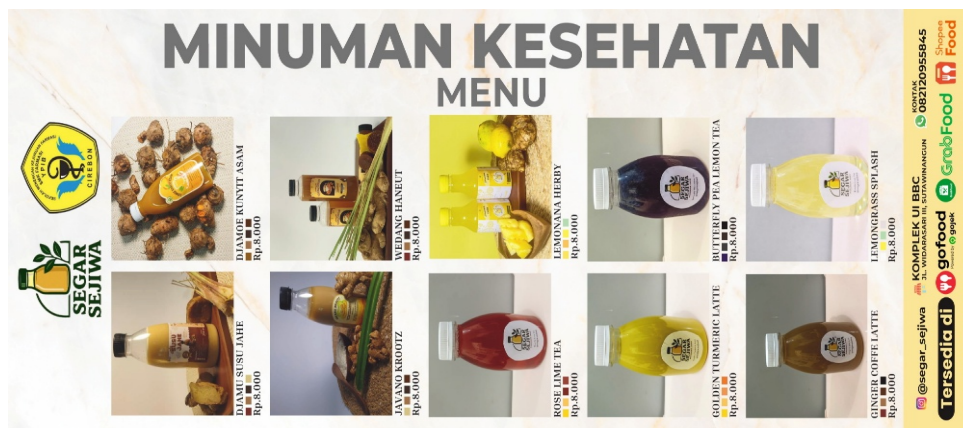
Gambar 7. Platform media sosial produk jamu SMK YPIB Cirebon

Terakhir adalah tahap evaluasi. pada tahap ini evaluasi yang dilakukan berupa 1). kehadiran dan keterlibatan peserta; selama kegiatan ini berlangsung tingkat kehadiran siswa hingga pelatihan selesai 98% artinya kegiatan ini sangat digemari oleh siswa SMK YPIB, 2). Pemahaman: evaluasi pemahaman ini dilakukan tiak berupa tes tulis ataupun post test melainkan dengan hasil kinerja dan tanya jawab peserta selama kegiatan berlangsung, dari hasil ini terlihat siswa sangat memahami bagaimana cara membuat jamu tradisional, mulai dari bahan yang dibutuhkan, takarannya, hingga bagaimana menganbil gambar yang ideal untuk dipasarkan. 3). Hasil akhir: evaluasi hasil akhir berhubungan erat dengan pemahaman siswa namun pada evaluasi ini lebih di tekankan pada hasil produk tiap kelompok, seperti kerapihan, kebersihan, dan estika gambar yang diambil.