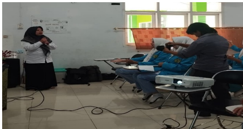
Gambar 2. Penyampaian materi terkait Jamu

Tahap ketiga pelaksanaan, pada tahap ini tim pengabdian dan mitra yang telah diberikan tugas untuk menyampaikan edukasi tentang pengenalan jamu sebagai obat tradisional yang secara turun-temurun digunakan sebagai minuman kesehatan dan menjadi budaya indonesia. dilanjutkan dengan edukasi terkait bahan-bahan yang dapat dibuat sebagai bahan dasar jamu berikut dengan manfaatnya. Serta teknik meracik jamu yang baik dan terjamin kebersihanya.