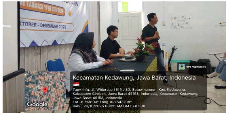
Gambar 3. Penyampaian materi pemasaran digital

mencapai pangsa pasar yang lebih luas. Selain itu siswa juga diajarkan bagaimana cara mendaftarkan produknya di platform tersebut termasuk cara pembuatan akun dll.