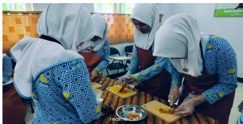
Gambar 4. Praktik meracik jamu tradisional

Selanjutnya pada tahap pelaksanaan di hari ke dua tim memberikan pelatihan pembuatan jamu, setelah siswa mendapatkan materi terkait jamu tradisional dan pemasaran digital selanjutnya siswa diinstruksikan untuk membuat kelompok peracik jamu dengan 1 kelompok berisikan 4 siswa. Siswa juga diinstruksikan membawa bahan-bahan yang telah ditugaskan oleh tim pengabdian beserta perlengkapan lainnya untuk kepentingan pembuatan jamu. Disisi lain tim pengabdian dan mitra juga telah menyiapkan bahan dan perlengkapan sesuai dengan yang direncanakan, seperti timbangan elektrik, tempat mencik jamu dll.