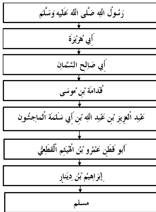
Bagan 1. Skema Sanad Hadis Riwayat Muslim No. 2720

Dalam mengkaji sanad hadis di atas, penulis fokus pada satu sanad hadis yang ditemukan dalam Shahih Muslim , kitab Zikri wa ad-Du'a , urutan hadis ke-71 dengan nomor hadis 2720. 16 Berikut ini skema sanad hadisnya: