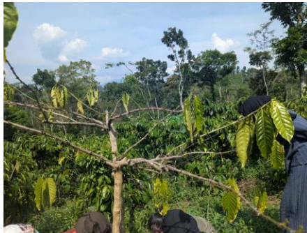
Gambar 1. Tanaman Layu akibat Kanker Batang

organik sebagai substrat pertumbuhan (Antriyandarti et al., 2022; Irawan & Antriyandarti, 2024).