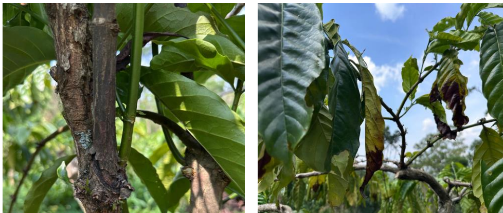
Gambar 5. Gejala Penyakit Kanker Batang Kopi Robusta

Hasil pengamatan lapangan menunjukkan bahwa pada perkebunan kopi robusta ( Coffea canephora ) di Desa Banjarsari, Kecamatan Kandangan, ditemukan penyakit kanker batang dan nekrosis akar pada tanaman kopi. Kondisi tanaman yang terserang dapat dilihat pada Gambar 5. Tanaman yang terserang akan mengalami layu pada pada daun, disebabkan karena terhambatnya aliran nutrisi dari akar dan batang. Gejala lain yaitu pecah-pecah pada jaringan kulit batang dan menghitamnya batang bagian bawah (Wiyono et al. , 2019). Gejala-gejala tersebut menunjukkan bahwa terjadi kerusakan jaringan dan terganggunya sistem metabolisme. Proses ini berujung pada kematian tanaman, sehingga menurunkan produksi perkebunan (Nadila et al. , 2025). Pada kasus di Desa Banjarsari, tempat bekas tanaman yang terserang penyakit tidak bisa ditanami lagi selama beberapa waktu, sehingga mengganggu proses re-planting . Kondisi ini membuat perkebunan tidak bisa berproduksi secara optimal.