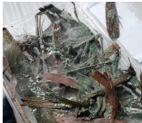
Gambar 7. Biang Trichoderma spp. 14 Hari setelah Inkubasi

Media tersebut kemudian ditunggu sekitar 10 – 14 hari, agar terjadi perbanyakan spora jamur. Selain nasi, media lain yang bisa digunakan adalah serbuk gergaji, dedak padi, sekam dan dedak jagung atau media lain yang mengandung serat, nitrogen, karbohidrat, fosfat dan kalium (Day et al. , 2022). Hasil perbanyakan tersebut adalah media yang ditumbuhi oleh koloni Trichoderma spp. Gambar 7 menunjukkan pertumbuhan Trichoderma pada serasah bambu yang selanjutnya digunakan untuk perbanyakan. Kondisi tersebut menunjukkan bahwa proses perbanyakan koloni Trichoderma spp. sudah berhasil dilakukan.