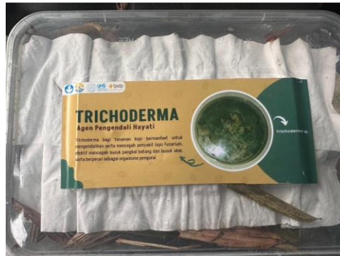
Gambar 6. Proses Pembuatan biang ( starter ) Trichoderma spp. dari Serasah Bambu

Kemudian petani diajarkan bagaimana mencegah dan mengobati penyakit nekrosis akar dan kanker batang dengan memanfaatkan bahan organik yang mudah ditemukan di Desa Banjarsari. Kegiatan pelatihan difokuskan untuk perbanyakan jamur Trichoderma spp. dengan memanfaatkan bahan dFari sekitar lingkungan petani seperti nasi dan serasah bambu, yang kemudian dimasukkan ke dalam wadah thinwall untuk menjadi media perbanyakan (Gambar 6).