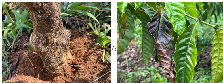
Gambar 2. Kanker batang kopi ( coffee stem cancer ) dan nekrosis akar

Salah satu permasalahan prioritas yang ingin diselesaikan melalui program Community Development ini adalah peningkatan produksi kopi secara bertahap dan berkelanjutan, namun tujuan tersebut terhambat oleh minimnya pengendalian hama terpadu serta input pupuk organik yang memadai. Kondisi agroekosistem Temanggung yang lembab, tanah dengan drainase rendah, serta budidaya tradisional tanpa penerapan sanitasi dan konservasi tanah yang baik, menciptakan lingkungan mikro tanah yang sangat ideal bagi perkembangan patogen tersebut.